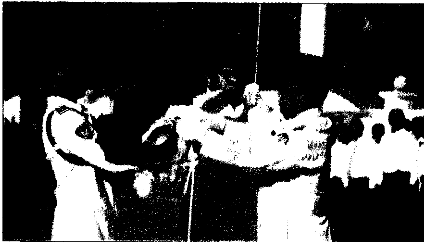
The unfurling of the Indonesian flag prior to its hoisting