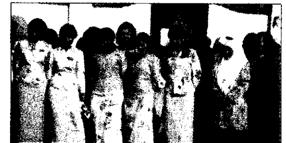
Several members of the Indonesian community who attended the event