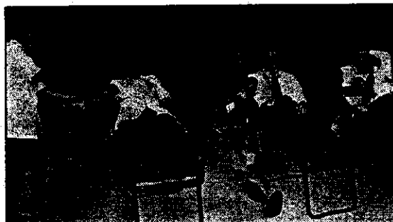
Indonesian Embassy staff bleeding for a cause